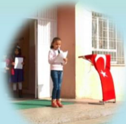
Mehmet Akif Ersoy'u Anma