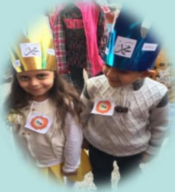
Mevlid-i Nebi Haftası