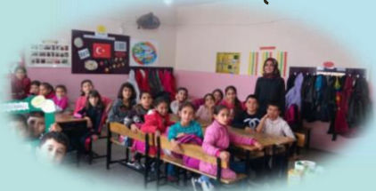
Tutum, Yatırım ve Türk Malları Haftası