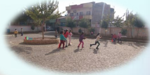
Yakar Top Oyunu