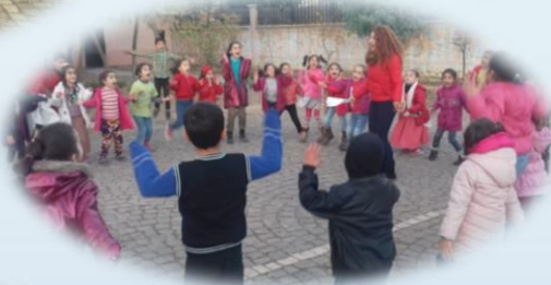
Mimik Ve Duygular