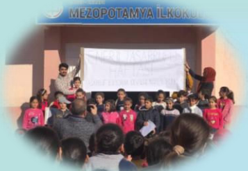
Enerji Tasarrufu Haftası