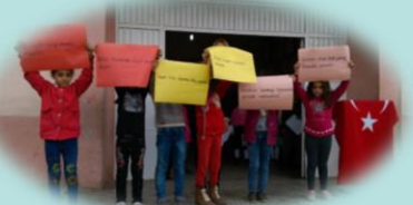
İnsan Hakları ve Demokrasi Haftası